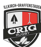
Club de Rugby d'Illkirch-Graffenstaden