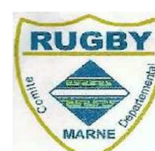
Comité Départemental de la Marne de Rugby