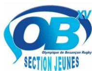
Olympique de Besançon Rugby