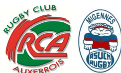
Entente Aux'igennes : Rugby Club Auxerrois / ASUC Migennes Rugby