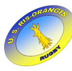
Union Sportive Ris-Orangis Rugby